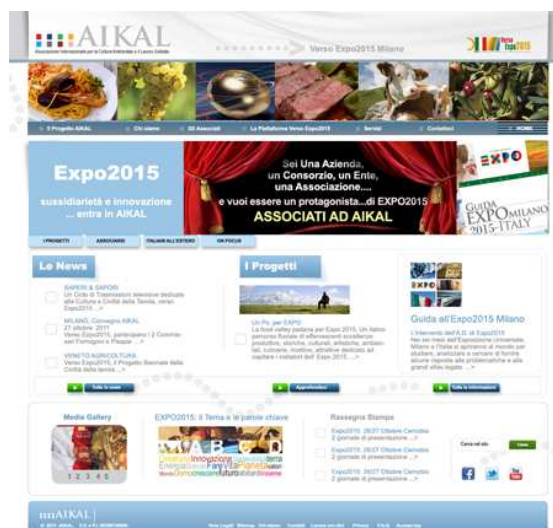
Home page con banner "associarsi"...