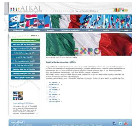
Second page con menu "PROGETTI"

"FARE ITALIA": VOCE E SOSTANZA ALL'OBIETTIVO DI VALORIZZARE LE ECCELLENZE ITALIANE